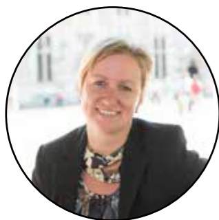
Inez De Coninck Federaal parlementslid (NMBS)