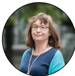
Lieve Maes Vlaams parlementslid (Financiën en Begroting, Vlaamse Rand)