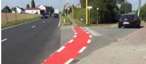
Veiligere oversteekplaatsen voor fietsers p.2