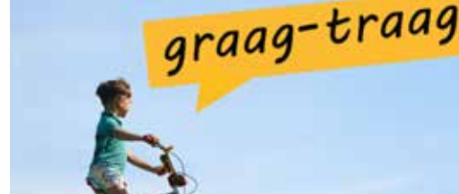
Maak je eigen graag-traag-affiche! p.3