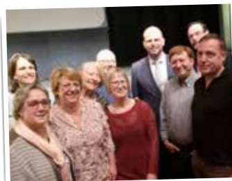
Een volle zaal voor de boeiende lezing van Theo Francken in Wemmel. Wij waren er ook!