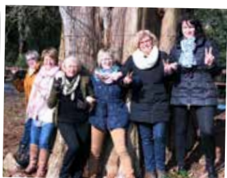
Kent u de sterke vrouwen van N-VA Meise al?